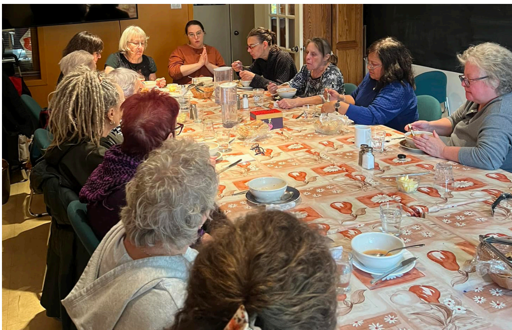
© Écho des femmes de la Petite-Patrie